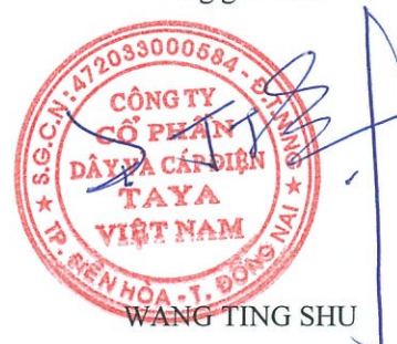
WANG TING SHU