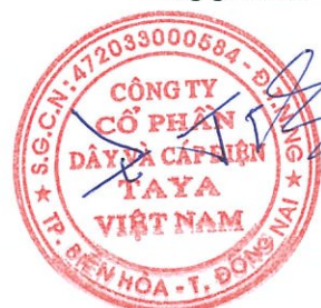
WANG TING SHU