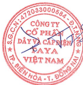
WANG TING SHU