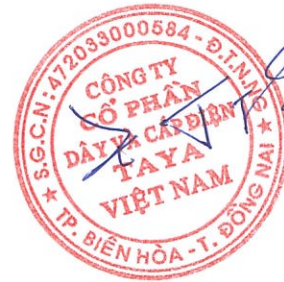
WANG TING SHU